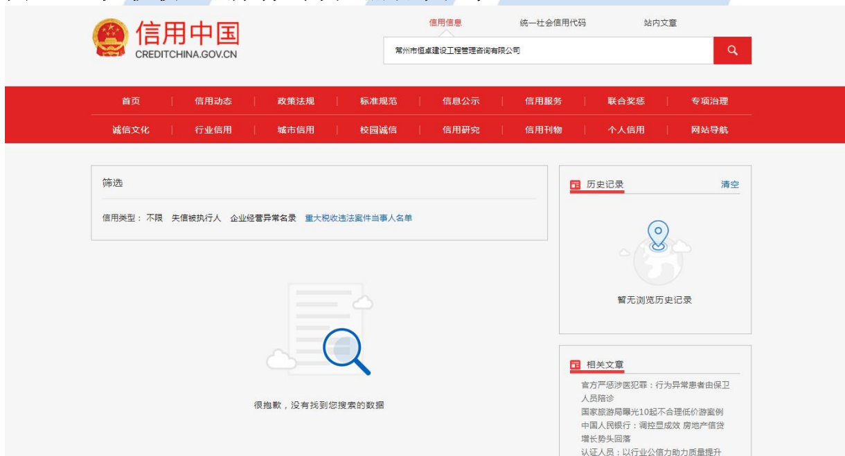
图 4 (相关基本信息范本)