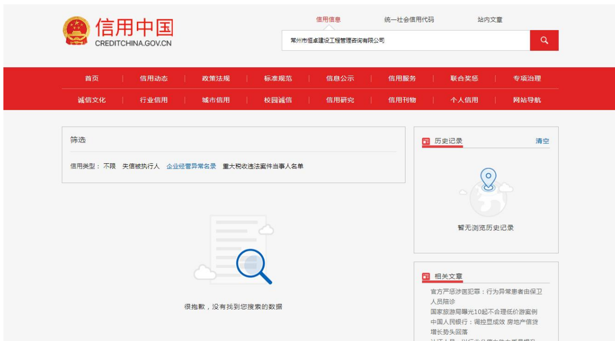
图 3 (重大税收违法案件当事人黑名单范本)