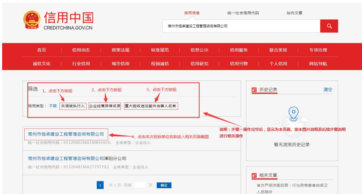
图 1（失信被执行人范本）